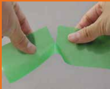
Einfaches Ablängen von Hand