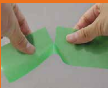
Einfaches Ablängen von Hand